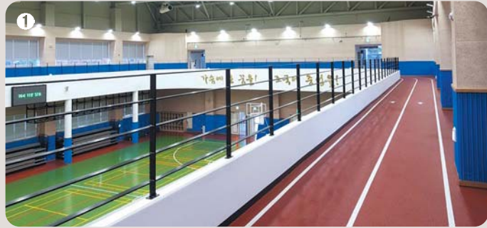
1 단식관 | 농구, 배드민턴, 테니스, 크로스핏 전용실, 조깅 트랙 등이 있는 다목적 체육관