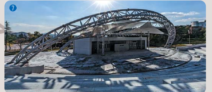
7 KAAAY광장 | 약 3천여명을 수용할 수 있는 대규모 행사를 위한 공간으로 학생들의 공연과 학교의 대표적인 행사들이 열리는 화합과 일량의 장소