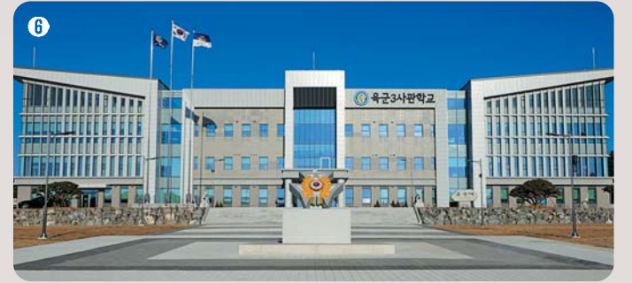
6 본관 | 학교 발전의 중심으로, 효율적이고 체계적인 환경을 제공하며 학교의 비전과 목표를 실현하기 위한 모든 계획이 시작된다.