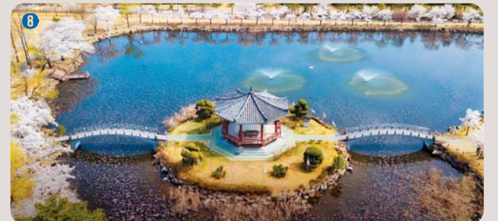
8 호국정 | 호국정신 계승을 위해 1983년 건립된 정자로 수목이 잘 조화된 한국형 정원과 호수인 호국정