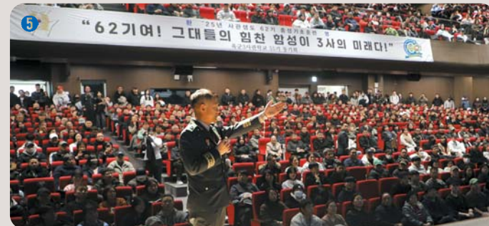
5 충성관 | 약 1,300석 규모의 실내 공연장으로 학생들과 간부들이 다양한 공연과 행사를 통해 문화적 소양을 높일 수 있는 공간