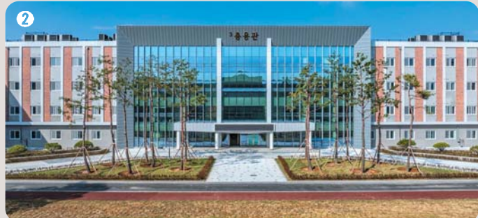
2 3층용관 | 최신 설비와 쾌적한 주거 공간을 제공해 학생들이 학업과 훈련에 전념 할 수 있도록 설계된 공간