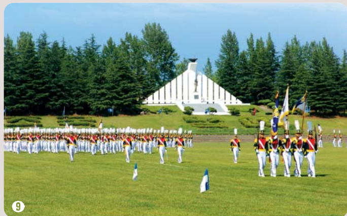
9 충성연병장 | 동양 최대규모, 10개의 축구장 규모 102,310㎡(31,100평)의 잔디 연병장으로 육군3사관학교의 상징

리더의 능력과 자부심을 고취시킬 수 있는 최고의 프로그램과 최상의 첨단 교육 시설 및 장비 , 여가를 위한 각종 편의시설과 레저, 스포츠 시설 을 완벽히 갖추고 있습니다.