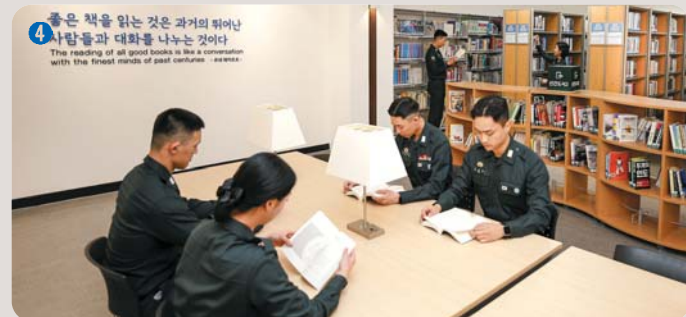
4 도서관 | 500평 규모 RFID(무선인식) 기반으로 운영되며 북카페 형태의 인테리어로 총 15만권의 장서를 보유한 학습공간이자 종합문화공간

과학적이고 논리적인 사고와 합리적인 의사결정 능력을 갖추기 위한 스마트한 교육환경 과 최적의 교육지원 체계 구축