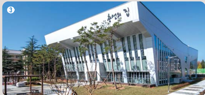
3 충성의 집 | 여가와 휴식을 위한 시설들로 학생들의 복지와 재충전을 돕는 공간